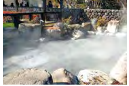
◀▲べっふ地獄めぐり (上) 鬼石坊主地獄 明治時代に「新坊主地獄」として観光名所となり、一時閉鎖後平成14(2002)年に再オープン。足湯などを併設。 (左) 国指定名勝 血の池地獄 奈良時代の書物「豊後風土記」にも登場する、確認できる中で最も古い地獄。地獄の泥で染色をしていたことも。