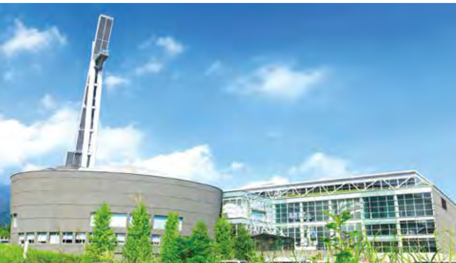
▲ 別府国際コンベンションホール(ビーコンプラザ) 約2~5000人を収容するコンベンションホールと、約1000人が入るフィルハーモニアホールを有する施設。大分県出身の建築家・磯崎新氏による設計で、国際会議や音楽イベントなど様々な用途に対応。特徴的な展望台「グローバルタワー」が隣接する。

絡橋は長さ約12・6m幅2mのPC橋を工場で作成し、現場まで搬入し一括架設したという。擁壁部分に引掛けるように架かる様は建築構造物ならではの。そしてシンポジウム会場となるコンベンションホールの観客席も、型枠を使って成形したプレキャスト部材だ。直線的に並べるのがセオリーの段床版を、なめらかな曲線で仕上げ建築物の造形美を追求している。会期中、ぜひ意識して見てほしいポイントだ。