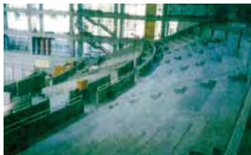
▶ 観客席の段床版(建設当時) 平成7(1995)年竣工、建設当時のコンベンションホールで活用された段床版。通常は台形の段床版を近似曲線的に配置しているが、本件は曲線の型枠を使用し、滑らかな曲線配置としている。