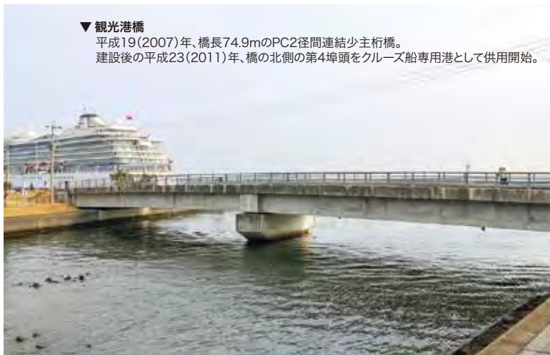
▼観光港橋 平成19(2007)年、橋長74.9mのPC2径間連続少主桁橋。建設後の平成23(2011)年、橋の北側の第4埠頭をクルーズ船専用港として供用開始。