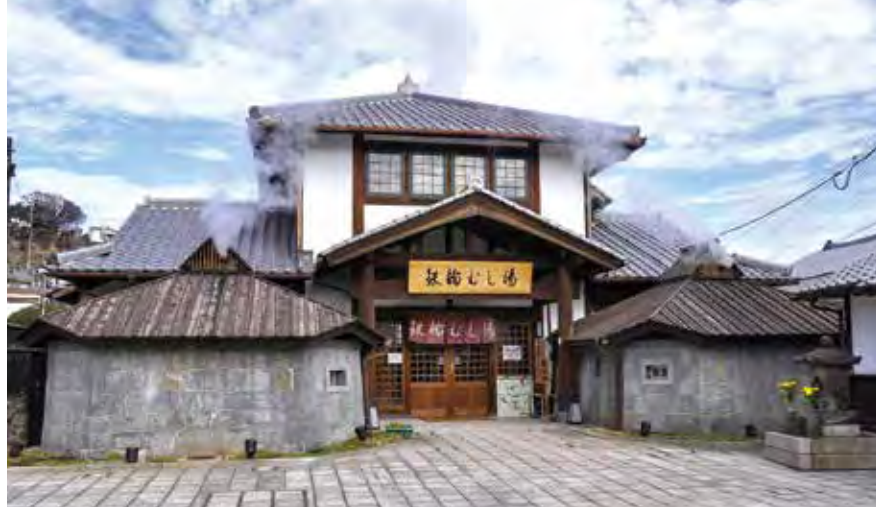
▲ 鉄輪むし湯 建治2(1276)年、諸国念仏行脚中の一遍上人が現在の上人浜で出会った老人に導かれ、鶴見岳麓の権現様のお告げにより創設されたと伝わる。施設前に無料の「足蒸し」も。