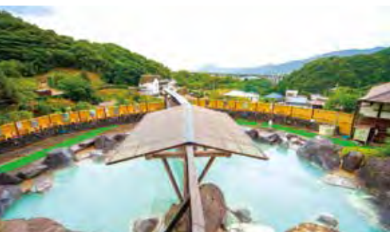
▲みよばん湯の里 天然入浴剤「薬用 湯の花」の製造直売所でもある日帰り温泉施設。大露天岩風呂のほか、湯の花小屋を模した貸切風呂などで硫黄泉を堪能できる。

湯の花小屋を眺めながらさらに坂を上がると、湯の花小屋の見学コースもある「みよばん湯の里」に到着。その中でも一番の高台にある大露天岩風呂で朝風呂だ。脱衣所の扉を開け中に入れば、遮るもののない空の下、目の前に別府明礬橋が！別府湾や鶴見岳までの眺望を背景に美しいアーチ橋のシルエットが浮かび上がり、私にとって最高の温泉に決定だ。エメラルドがかかった乳白色の湯は、肌へのクレンジング効果もあるのだとか。このあと保湿効果のある温泉に入ると美肌効果が高まると案内があつた。泉質違いの温泉が近くにあると、そんな使い方もできるのか！次回訪れるまでに各エリアの湯を研究しよう！と心に決めた。