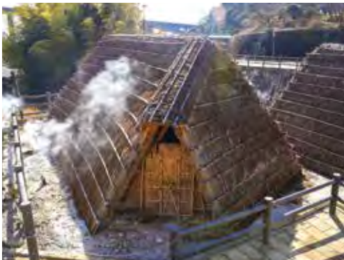
▲湯の花小屋(岡本屋旅館) わら屋根の中で温泉ガスの蒸気を結晶化させ、江戸期からミョウバン製造に使われた小屋。明治期に入浴剤として製品化。「小屋方式」での湯の花採取は明礬地域にのみ伝わる。

すつきりと晴れた翌朝は、いよいよ「別府明礬橋」へ。橋が架かる明礬温泉エリアは、別府湾を見下ろす高台にあり、その眺望も魅力の一つ。アーチ橋が採用されたのも景観を妨げない、むしろ美観を高めるものとの考えがあつてのこと。地獄蒸し®プリンで有名な岡本屋旅館の売店は明礬橋を眺めるベストスポットと聞いて車を降りると、眼下に橋と海を望む絶景に思わずうわあ！と声を上げた。次の瞬間、地面のそここから噴出する強い硫黄のにおいの湯けむりにもくもくと巻かれて思わずむせ返る。