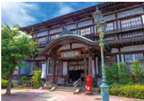
▲竹瓦温泉 明治12(1879)年に開かれた、下町エリアに佇む湯。男湯は塩化物泉で体を温め、女湯は炭酸水素塩泉で、角質などを落とし肌がすべすべになる効果が期待できる。

本当は砂湯も試してみたかったのだけれど、数時間先まで予約でいっぱい。次回こそはと決意して別府タワーの夜景を眺めながら宿に戻り、ぐっすりと眠ったのだった。