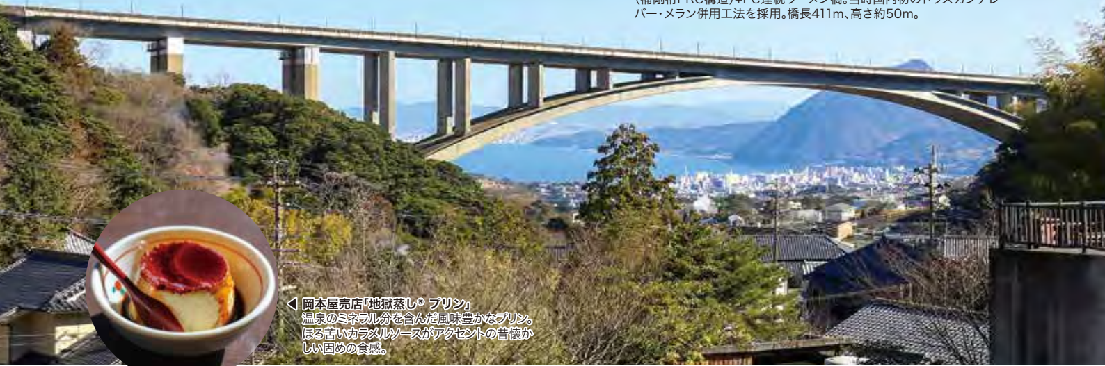
◀岡本屋売店「地獄蒸しプリン」 温泉のミネラル分を含んだ風味豊かなプリン。 ほろ苦いカラメルソースがアクセントの首懐か しい回めの食感。

▼別府明礬橋 平成元(1989)年に開通した、遠く別府の街を望むRC固定アーチ橋 (補剛桁PRC構造)+PC連続ラーメン橋。当時国内初のトラスカンチレ パー・メラン併用工法を採用。橋長411m、高さ約50m。