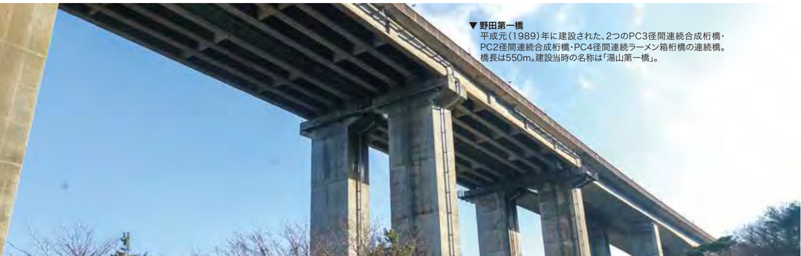
▼野田第一橋 平成元(1989)年に建設された、2つのPC3径間連続合成桁橋・PC2径間連続合成桁橋・PC4径間連続ラーメン箱桁橋の連続橋。橋長は550m。建設当時の名称は「湯山第一橋」。

始める。これを含めた九州各所へ伸びる高速道路は、「九州の命の道」ネットワークとして経済・観光を活性化し、災害の多い九州各地を結んでスムーズな被災者支援を可能にしているようだ。