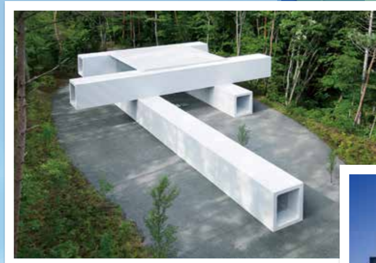
土管のゲストハウス

公益社団法人 プレストレストコンクリート工学会 一般社団法人 日本建築学会 一般社団法人 日本建築構造技術者協会 一般社団法人 東京建築士会 公益社団法人 日本コンクリート工学会 公益社団法人 大阪府建築士会 公益社団法人 愛知建築士会 一般社団法人 東海建築構造設計事務所協会