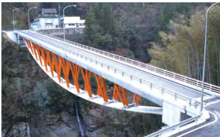
▲写真16 青雲橋(徳島県)