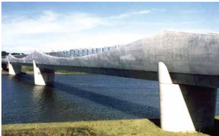
▲写真17 鳴瀬川橋りょう(宮城県)

ので、プレストレスを導入する必要はなく、PC橋の範疇には入らないとする考え方もあるが、PC橋の架設工法と同様な片持ち張出し架設が適用されることや補剛桁にはプレストレスが導入されることなどから、広義にはPC橋とみなすこともできる。ここでは、赤谷川橋りょう(1979年、写真12)、別府明礬橋(1989年、写真13)、池田へそつ湖大橋(1999年、写真14)、コロラド