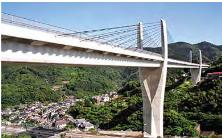
▲写真8 日見夢大橋(長崎県)