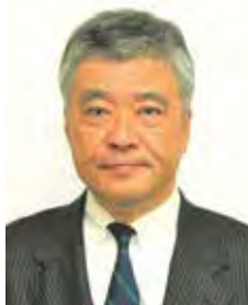
東京工業大学名誉教授