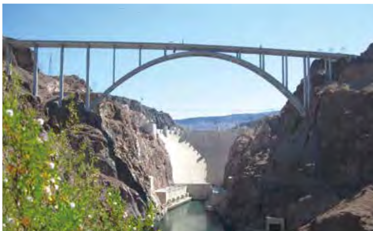
▲写真15 コロラドリバー橋(アメリカ・ネバダ州)