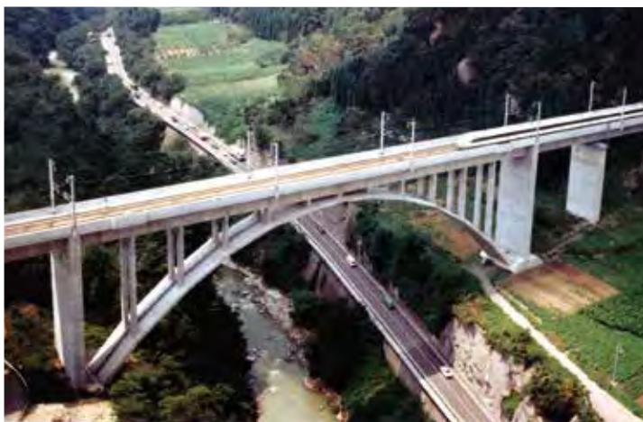
▲写真12 赤谷川橋りょう(群馬県)

た。また、コンクリート床版と波形鋼板の接合部のディテールが構造上のポイントとなるが、本橋では鋼板に設けた鉄筋孔を通した貫通鉄筋と橋軸方向の接合棒鋼を併用した埋込み接合が採用されている。日見夢大橋は、長崎多良見ICと長崎芒塚IC間に建設された長崎自動車道の橋梁で、橋長365m、中央径間180mの3径間連続波形鋼板ウェブPCエクストラード橋である。波形鋼板ウェブとエクストラード橋の組合せとしては世界初であった。この組合せにより主桁の軽量化を図ることができ、支間長180mに対して桁高4mと非常にスレンダーな構造を実現している。斜材の定着部には波形鋼板ウェブと溶接によって一体化した鋼製ダイヤフラムを配置し、十分な安全性を確保している。近江大鳥橋は、新名神高速道路の大江JCTと信楽IC間に位置する、4径間連続(上り線)および5径間連続(下り線)の波形鋼板ウェブPCエクストラード橋である。橋長は495m(上り線)および555m(下り線)で、最大支間は170m(上り線)および160m(下り線)である。本橋は県立自然公園内に位置することから自然環境と調和した景観設計がなされた。主塔と橋脚は鶴が翼を広げて飛翔する姿を