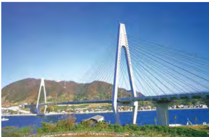
▲写真1 生口橋(広島県)