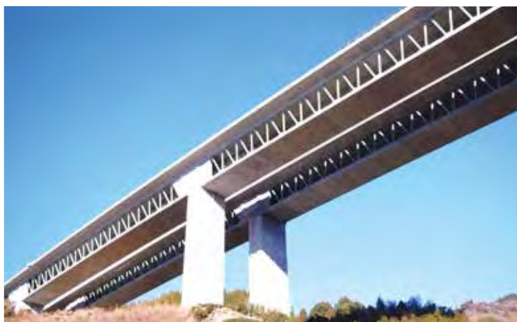
▲写真5 猿田川橋・巴川橋(静岡県)

木ノ川高架橋(2003年、写真4)、猿田川橋・巴川橋(2009年、写真5)、不動大橋(2010年、写真6)などである。木ノ川高架橋は那智勝浦新宮道路が和歌山県新宮市で二級河川・佐野川の支流である木の川と交差する位置に建設された4径間連続鋼コンクリート複合トラス橋であり、複合トラス橋としてはわが国最初のものである。橋長は268mで最大支間は85mである。上下のコン