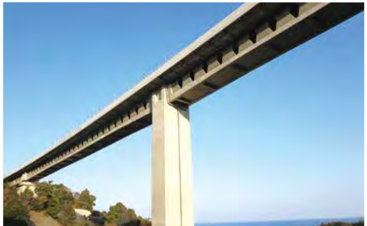
▲写真20 寺迫ちょうちょ大橋(宮崎県)

ワードとしては、プレキャスト化、新材料・新素材、環境・景観などが浮かんでくる。新東名高速道路の内牧高架橋(2006年、写真18)は静岡市内で内牧川と交差する位置に建設された21径間連続PC箱桁橋であり、橋長は1048 m(上り線)および1024 m(下り線)で、最大支間は53 mである。ここではプレキャストセグメント工法が大々的に適用された。本橋は有効幅員16・5 mであり、