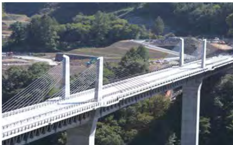
▲写真6 不動大橋(群馬県)

岡市街の北側を通過する新東名高速道路の橋梁であり、それぞれ7径間連続、5径間連続の複合トラス橋である。猿田川橋は橋長610mで最大支間が110m、巴川橋は橋長479mで最大支間が119mである。ウェブには鋼管トラスが使用され、主桁の軽量化が図られている。さらに、下り線では4主構であったトラスを、上り線では3主構に低減した他、格点部には改良版の二面ガ