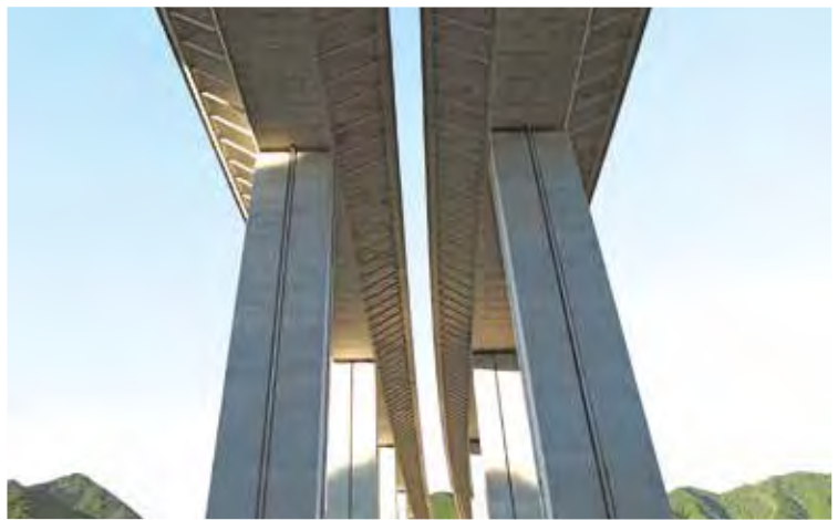
▲写真18 内牧高架橋(静岡県)

色の鋼管トラスが美しい。 フィンバック橋は、箱桁のウエブを上方に伸ばして翼壁とし、ここにPC鋼材を配置した橋梁である。主桁に作用する曲げモーメントに対して、PC鋼材の偏心量を大きくでき、主桁の高さを抑えることができる。魚の背びれ (back fin) からきた名称である。宮城県東松島市に位置するJR仙石線の鳴瀬川橋りょう (1999年、写真17)は橋長488・