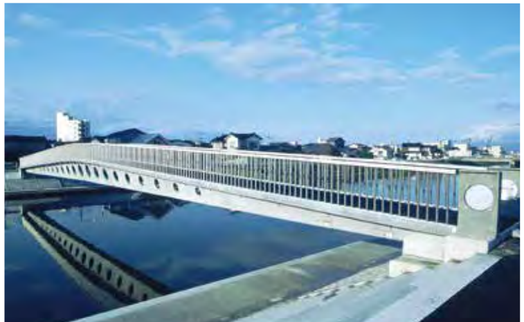
▲写真19 酒田みらい橋(山形県)

9 m、最大支間85 mの6径間連続PCフィンバック橋であり、その独特な形態が特徴である。本橋は東日本大震災時の津波にも流出することなく、原形を保った。 PC橋の将来 社会インフラの重要性を考えると今後さまざまなPC橋が建設されていくものと思われるが、そのキー