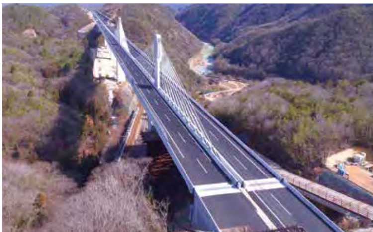
▲写真10 生野大橋(兵庫県)