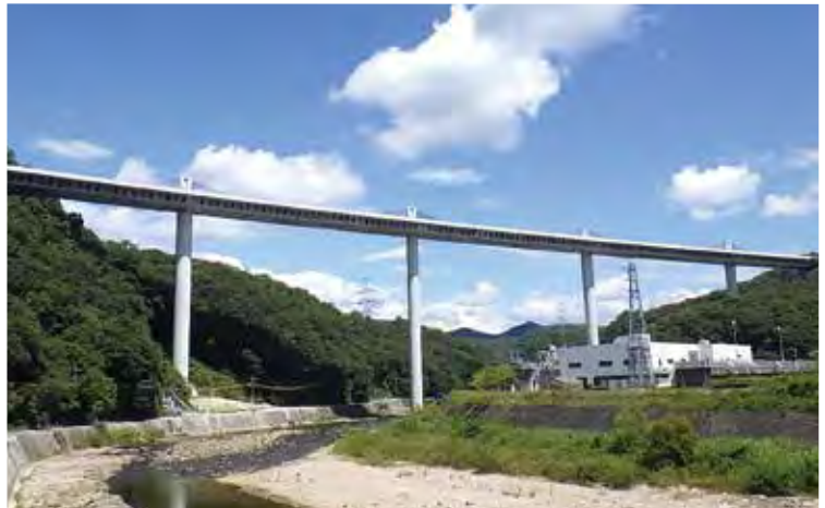
▲写真21 新名神武庫川橋(兵庫県)

通常であれば2室箱桁となるが、合理性や経済性を追求し、ストラットで張出し床版を支える1室箱桁構造が採用された。さらに1スパン約50 mの箱桁を、16個のプレキャストセグメントを連結して架設するスパンバイスパン工法が適用された。 酒田みらい橋(2002年、写真19)は山形県酒田市の新井田川に架かる橋長50・2 m、支間49・4 mの単径間PC箱桁歩道橋である。箱桁