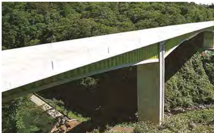
▲写真7 本谷橋(岐阜県)

岡市街の北側を通過する新東名高速道路の橋梁であり、それぞれ7径間連続、5径間連続の複合トラス橋である。猿田川橋は橋長610mで最大支間が110m、巴川橋は橋長479mで最大支間が119mである。ウェブには鋼管トラスが使用され、主桁の軽量化が図られている。さらに、下り線では4主構であったトラスを、上り線では3主構に低減した他、格点部には改良版の二面ガ