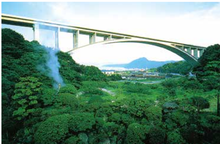
▲写真13 別府明礬橋(大分県)

モデルとしている。さらに周辺地山に露頭している風化花崗岩の色調を考慮してベージュ色のカラーコンクリートが使用された。また、その色合いとの調和を考慮して波形鋼板も朱色に着色されている。生野大橋は、新名神高速道路とJR福知山線が交差する神戸市北区生野に位置する橋長606m、最大支間188mの7径間連続波形鋼板ウェブPRCエクストラード橋である。将来の6車線化を考慮して、斜材は一面吊り構