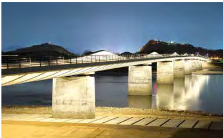
▲写真22 各務原大橋(岐阜県)