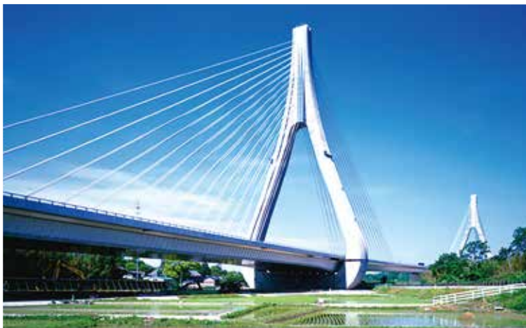
▲写真11 豊田アローズブリッジ(愛知県)

セツト構造を適用している。ウェブの透過性が向上した結果、景観性が向上し、軽快な印象を与えることに成功している。不動大橋は、群馬県長野原町に建設された八ッ場ダムの湖面橋である。八ッ場ダム建設工事が中止されていた時期に、ダム建設工事中止の象徴としてテレビで度々映し出されていたことから記憶されている方も多いと思われる。本橋は橋長590m、最大支間155mの5