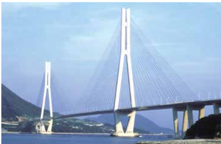
▲写真2 多々羅大橋(広島県)