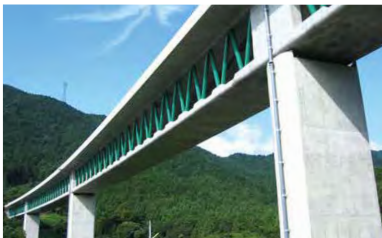
▲写真4 木ノ川高架橋(和歌山県)

同一断面内にコンクリートと鋼材を併用した複合構造の橋梁として、複合トラス橋が建設されている。これはPC箱桁橋のウェブを鋼トラス部材で置き換えたものであり、主桁の軽量化を図るものである。当初、フランスで実用化された複合トラス橋であるが、2000年代になってわが国でも建設されるようになった。