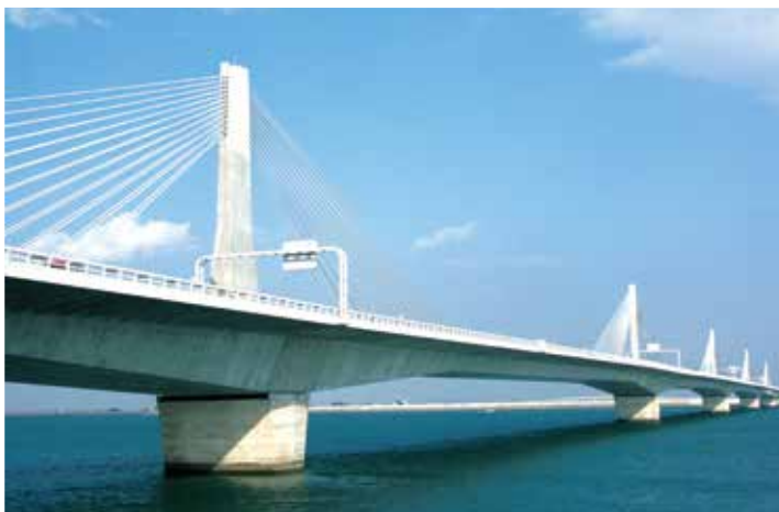
▲写真3 木曾川橋・掛斐川橋(三重県)