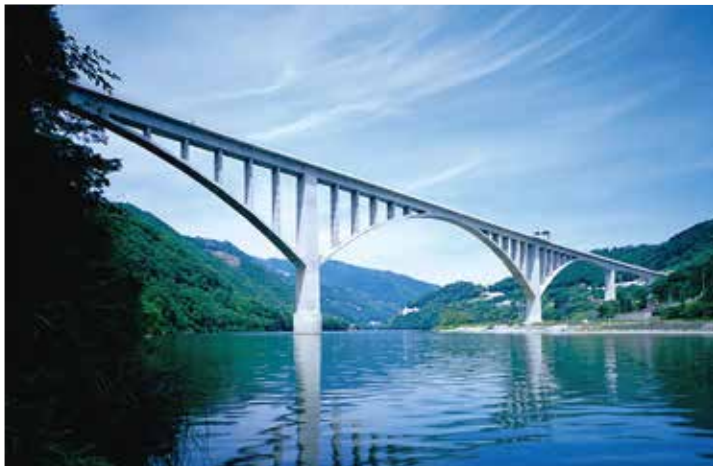
▲写真14 池田へそっ湖大橋(徳島県)

造となっているが、波形鋼板ウェブエクストラード橋への一面吊り斜材の適用は国内初である。豊田アローズブリッジは、新東名高速道路と東海環状自動車道との共用区間である豊田JCTと豊田東JCT間に建設された4径間連続の波形鋼板ウェブPC・鋼複合斜張橋である。橋長は820m、最大支間は235mであり、波形鋼板ウェブを有する斜張橋として世界最長である。上下線一体の主桁総幅員43・8mは