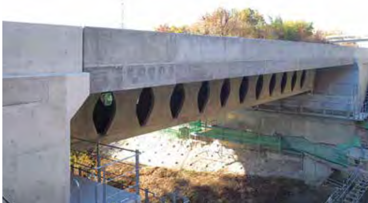
▲写真23 別荘谷橋(徳島県)

にはわが国で初めて超高強度繊維補強コンクリート(UFC)が適用された。UFCを活かした薄肉部材(上床版厚5cm、ウェブ厚8cm)の使用やウェブに設けた円形開口部など、斬新で特徴的な橋梁となっている。寺迫ちようちよ大橋(2013年、写真20)、新名神武庫川橋(2016年、写真21)はいずれもバタフライウェブを使用したPC橋である。寺迫ちようちよ大橋は、東九州自動車