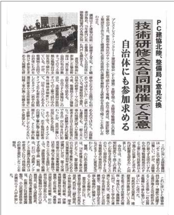
平成27年2月6日(金)日刊建設工業新聞

今日の建設業を取り巻く状況を反映し、①改正公共工物品質確保促進法に伴う入札制度、②維持補修工事の諸問題、③若手技術者の確保・育成について、などの意見を交換しました。