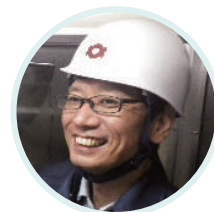
下村 匠 教授