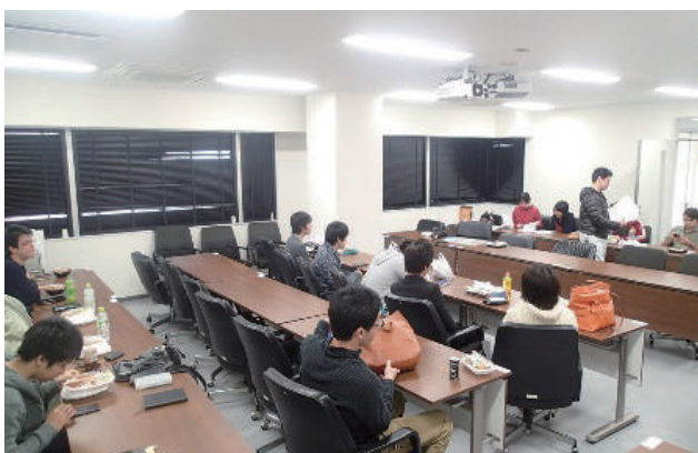
写真-1 昼食会の様子

害、鋼材腐食を考慮した数値解析、 物質移動に関する数値解析、乾燥 収縮・クリープに関する実験的・解 析的検討、津波の流体解析、非破壊 検査に着目した研究など、多岐にわ たる。現在、PC関係の研究として、 「鋼材破断の生じたポストテンショ ン橋の数値解析による耐荷性状の 評価」、「断面修復の有無がプレテン ションPC部材の構造性能に与え る影響」に関するものを行っており、 筆者は前者の研究を行っている。こ こで、筆者の研究について少々紹介 する。現在、塩害等により鋼材腐 食・破断の生じたPC橋の残存性能 を評価する手法の開発が急務となっ ている。そこで、筆者らは3次元有 限要素解析(以下、FEM)に着目 した残存性能評価手法の開発を試 みている。また、非破壊検査により 鋼材破断箇所を検知した結果を組 み合わせて、非破壊検査による検知