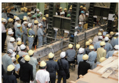
写真-4 PC橋桁の載荷試験