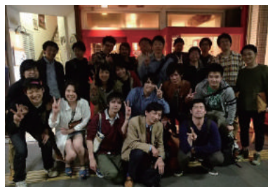
写真-7 コンクリート構造研究室一同

研究室旅行、花火、忘年会、スキー旅行など、多数行っている。研究室旅行は、現場見学を兼ねて行っている場合が多い。本研究室の名物イベントとして、週に1回、「昼食会」と「ゼ