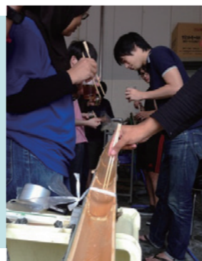
流しそうめん会の様子