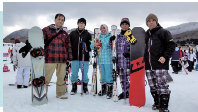
Ski and snowboard at Kuju