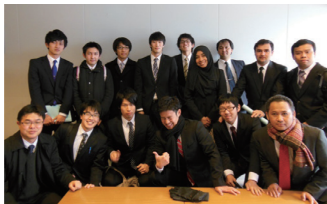
Concrete Laboratory members in JSCE Seibu Branch Conference

Concrete Engineering Laboratory of Kyushu University was established in 1914, and more than 500 students from Japan and overseas had been graduated from this laboratory. Currently, there are 2 academic staff, 1 technical officer, 11 Japanese students and 6 international students (5 students from Indonesia and 1 student from Afghanistan). At this time, so many research topics on going in Concrete Engineering Laboratory such as alkali-silica reaction (ASR), utilization of sea water in concrete mixed, electrochemical research on corrosion and corrosion prevention of steel in concrete and geo-polymer concrete. Furthermore, several collaborative researches with industrial and stakeholders for concrete structure where are carried out in Concrete Engineering Laboratory from many couple years ago until now.