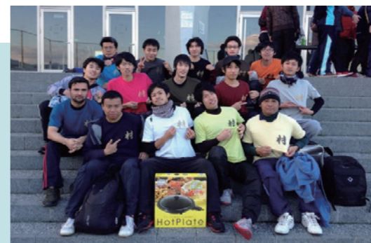
ソフトボール大会の様子